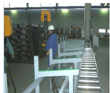
Aufbau mit optionaler Materialzuführung Assembly with optional material loading