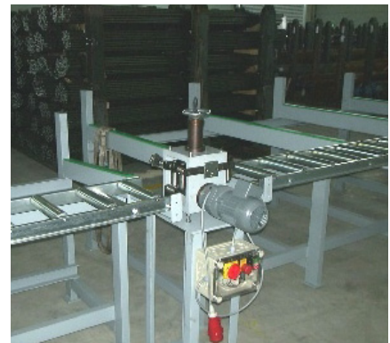
Aufbau mit optionalem Untergestell Assembly with optional base frame